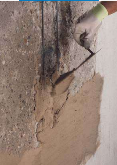
Applicazione a cazzuola di Planitop Rasa & Ripara