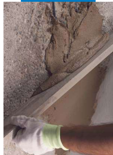
Staggiatura di Planitop Rasa & Ripara