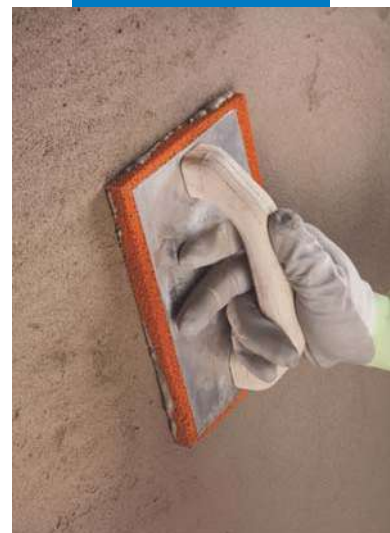
Frattazzatura di Planitop Rasa & Ripara