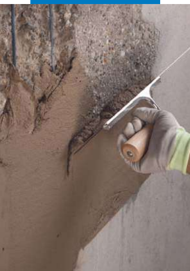
Applicazione a spatola di Planitop Rasa & Ripara

Planitop Rasa & Ripara: malta cementizia tissotropica fibrorinforzata a presa rapida, a ritiro compensato, per il ripristino e la rasatura del calcestruzzo, marcata CE secondo CPD 89/106 in conformità ai requisiti della norma EN 1504-3 classe R2 e della norma EN 1504-2 rivestimento (C) principi MC e IR.