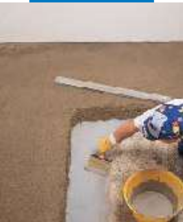
Applikation der Haftschrämme für den Topcem-Estrich