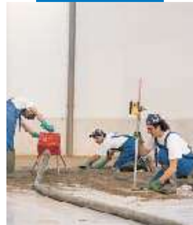
Einbringen des Topcem-Estrichs