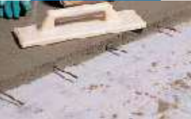
Topcem-Estrich-Verdübelung im Bereich der Arbeitsfugen