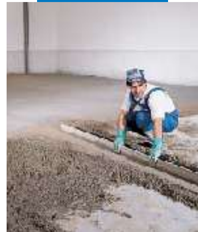
Abziehen des Topcem-Estrichs