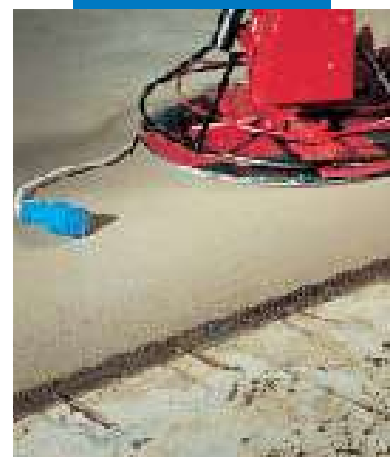
Bearbeitung der Topcem-Estrich-Oberfläche mittels Flügelglätter