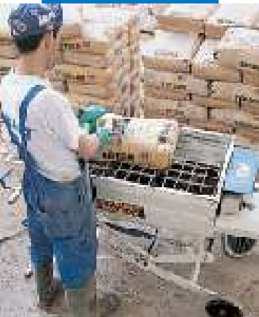
Anmischen des Topcem-Estrichmörtels