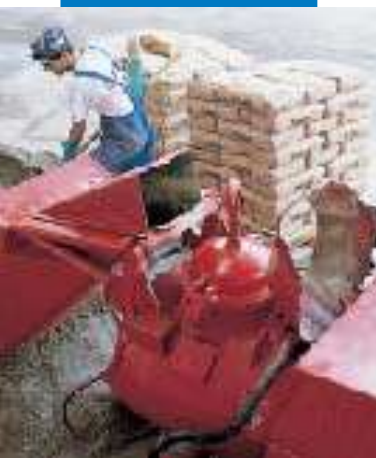
Geeignete Misch- und Fördertechnik für den fachgerechten Einbau des Topcem-Estrichmörtels