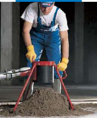
Fördern des Topcem-Estrichmörtels mittels Estrichpumpe

Frischestrich eine erdfeuchte Konsistenz erreicht und dass dieser bei Verdichtung und Oberflächenbehandlung kein Wasser absondert. Der angemischte Frishestrich ist innerhalb einer Stunde zu verarbeiten. Das Anmischen erfolgt mit einem Zwangsmischer. Die Förderung des Frischstoffgemisches kann mittels herkömmlicher Estrichpumpen erfolgen.