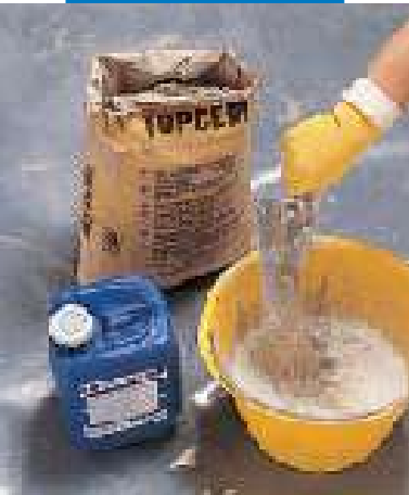
Herstellung einer geeigneten Haftschrämme mittels Topcem und Planicrete