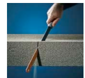
Leicht zu bearbeiten